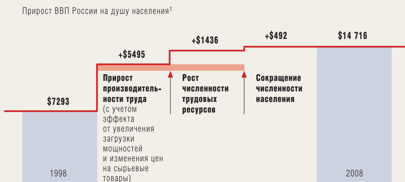
СХЕМА 3: Быстрые темпы роста производительности труда, 1998—2008 гг.

Стабильного роста можно достичь только при условии более эффективного использования ресурсов страны, т.е. за счет повышения производительности. В этом смысле у России есть ряд преимуществ. Для